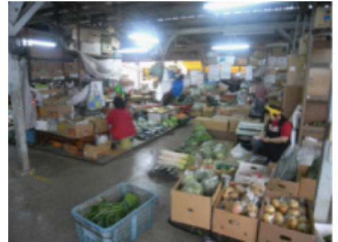
【従前の農連市場の様子】

変わりゆく那覇市を是非とも視察していただきたく、多数の会員等の皆様のご参加をお待ちしております。